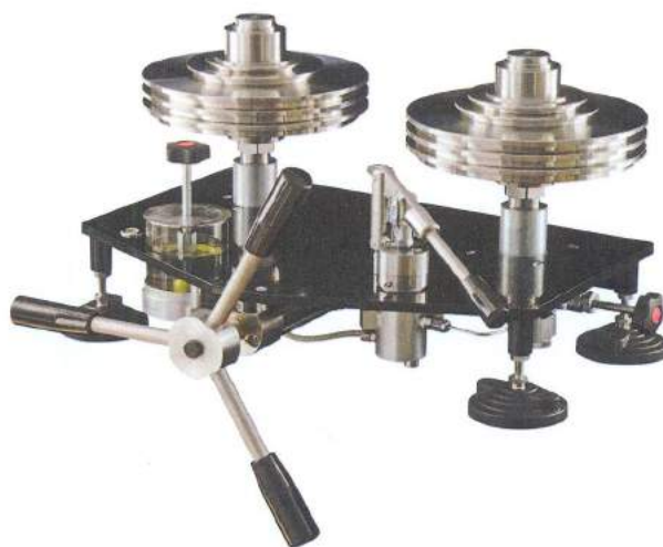
Рис. 2 Манометры грузопоршневые МП (УСД специального исполнения)