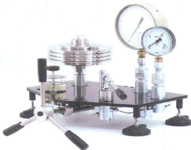
Рис. 1 Манометры грузопоршневые МП (УСД обычного исполнения)

УСД обычного исполнения имеет два места для установки поверяемых (калибруемых) приборов. УСД специализированного исполнения имеет одно место для поверки ИПС грузопоршневого манометра и снабжено устройством для наблюдения за положением поршней. В зависимости от диапазона измерений манометры выпускаются в 6 модификациях в соответствии с таблицей 1.